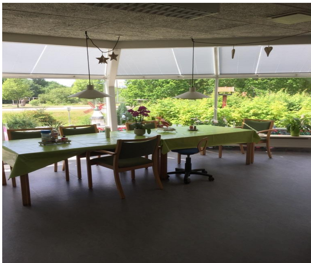
Afdeling: Valmuens lille spisekrog.

Vil du være medlem og støtte foreningen, kan Lindhøjs sekretær være behjælpelig med at formidle kontakten. (60 kr. årligt, 100 kr. for en familie).