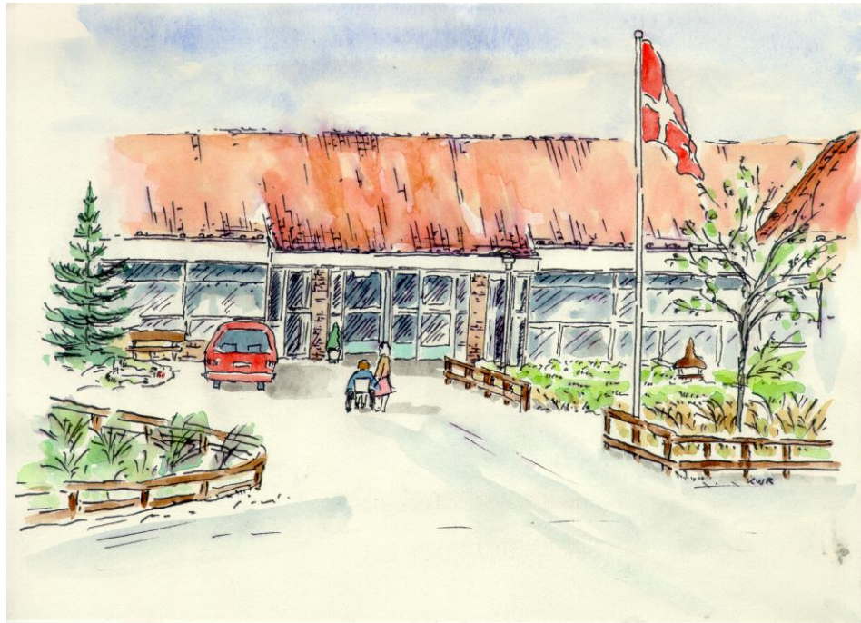
Håndtegning af Lindhøj som det så ud i slutningen af 80'erne.

Vi ønsker et godt samarbejde med dig og dine pårørende. I det omfang I som pårørende har mulighed for det ønsker vi, at I tager del i beboerens hverdagsliv og aktiviteter. Kan du ikke selv klare at tage af sted til læge, tandlæge, sygehus o.l. må dine pårørende som udgangspunkt følge dig.